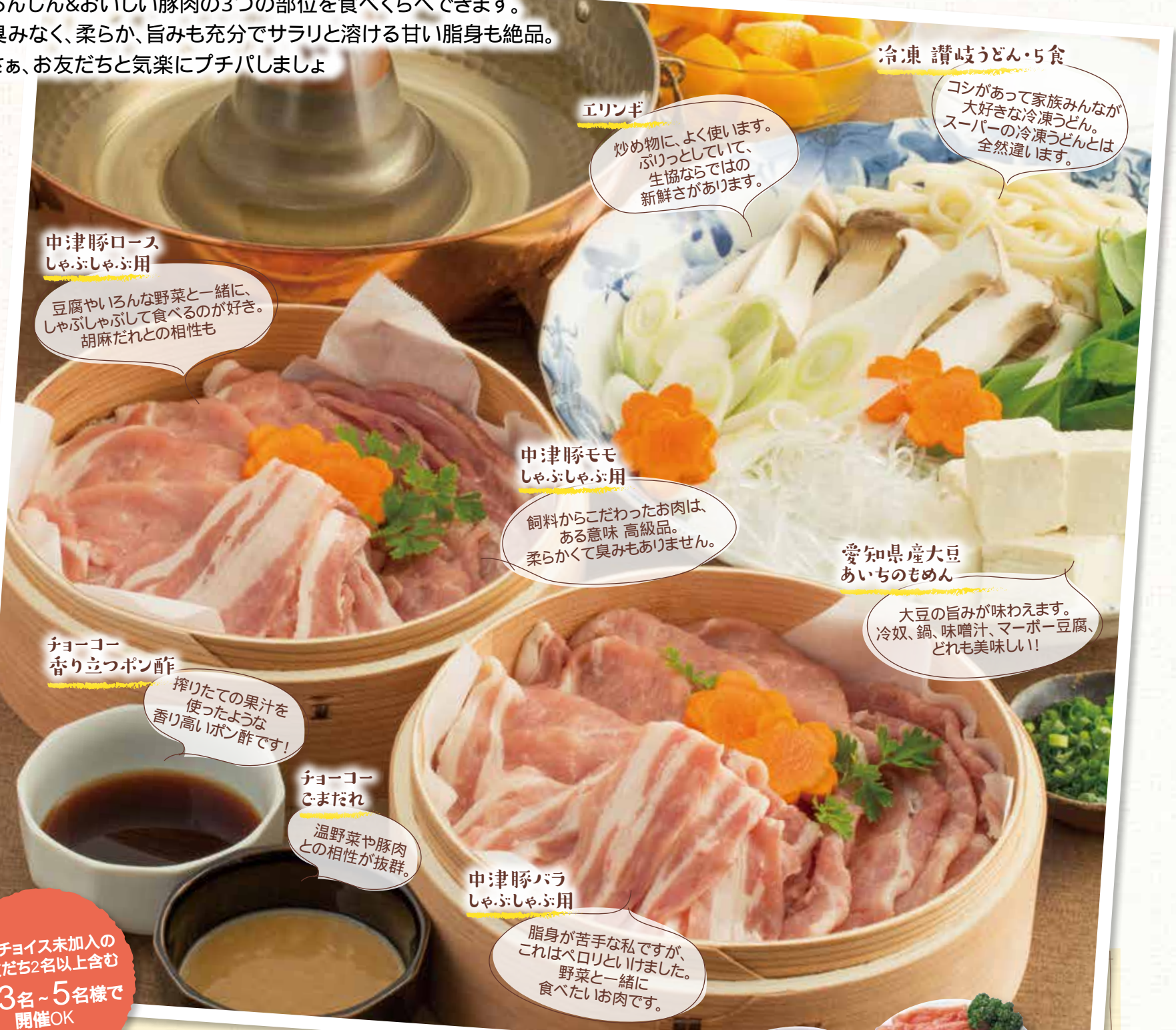
中津豚ロース しゃぶしゃぶ用

クチコミでも好評のアイチョイスの定番産地、中津ミートの豚肉を使った「豚しゃぶ」。あんしん&おいしい豚肉の3つの部位を食べくらべできます。臭みなく、柔らか、旨みも充分でサラリと溶ける甘い脂身も絶品。さあ、お友だちと気楽にプチパしましょ