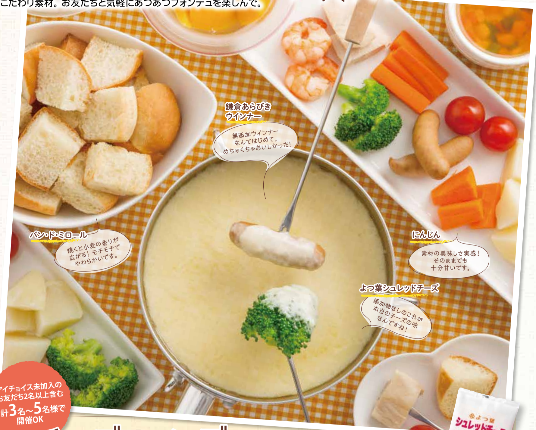
鎌倉あらびき ウインナー

プチパなら、準備いらずでチーズフォンデュパーティーができちゃう！ 具材だけでなく、チーズに加えるワインまですべてアイチョイスの こだわり素材。お友だちと気軽にあつあつフォンデュを楽しんで。