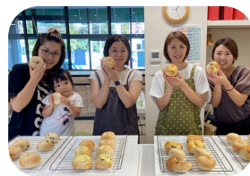
メイキングベーグルズ