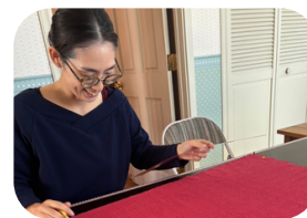
ゆるっとソーイング