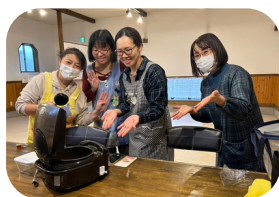
美味しく、簡単、時短料理の会