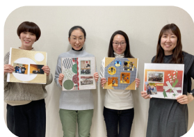
スクラップブックングでアルバム作り