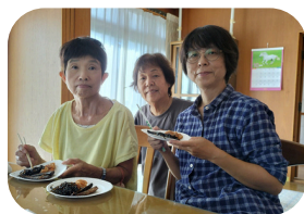
挑戦したい！おすすめしたい！商品の食べ比べ