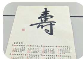
日本の伝統文化・技能にふれる会