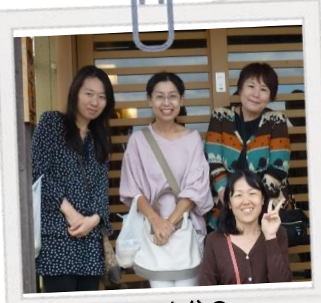
弥富・蟹江在住の7人で元気に活動中！