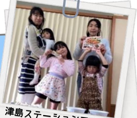
津島ステーションでわいわい活動しましょ！

和気あいあいと商品を試食しながら、生協商品や地域の情報、子育ての話などをしています。子連れで参加するので楽しく、賑やか♪食育にもつながり、たまごを割ったり、箸を並べたりお手伝いもしてくれます。生協の集まりは子どもも楽しみみたい♡料理・食べる事・お話が好きな方などたても大歓迎。まずは見学からでも大丈夫、津島市・あま市・大治町・中区・港区の方！一緒に活動してみませんか？