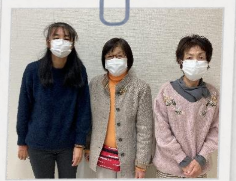
初めての方も大丈夫♪ 組合員理事がサポート！