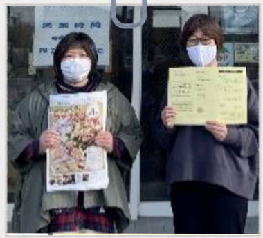
佐織・八開・立田・佐屋の方、待ってま〜す！