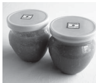
▲プリン状廃油せっけん