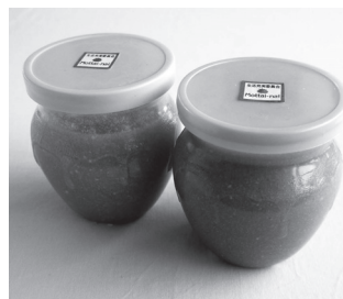
▲プリン状廃油せっけん